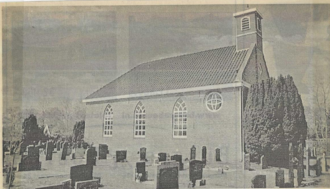
Recente opname van het kerkgebouw te Boelenslaan